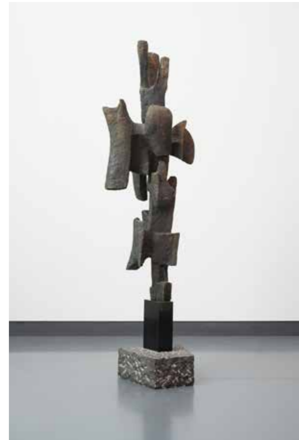
Alicia Penalba Ombre Habitée , 1957 Collectie Van Abbemuseum

This art review makes it clear that the basic form of the visual treatment of time becomes visible in the collection items of Gerrit van Bakel, Ossip Zadkine and Alicia Penalba. They imitate cyclical processes that are connected to natural processes.