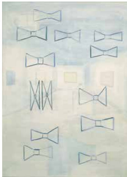
René Daniëls Het huis , 1986 Collectie Van Abbemuseum

Altijd schilderij te zien, ach/ was toch tekening gebleven. René Daniëls, citaat gedicht in Spreeksels (2007)