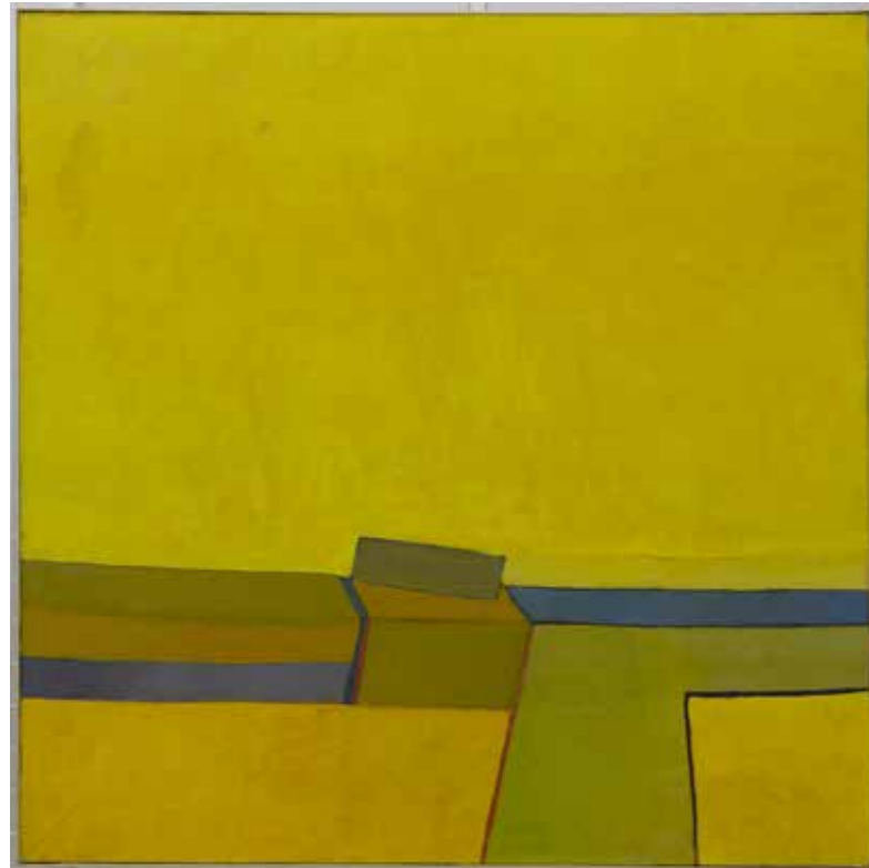
Willem Adams Groot geel landschap, 1968 Collectie Van Abbemuseum

in zijn schilderijen, maar ook in zijn tekeningen, waar Willem ook heel goed in was trouwens. En hij was zeer emotioneel." Museumdirecteur Rudi Fuchs schreef al in de goudgele (!) catalogus behorende bij Adams solotentoonstelling (1987) in ons museum: "Voor hem had kunst te maken met grote emotie - met wind in de bomen en de branding op het strand." Een specifieke plek waar Adams dit werk maakt, is niet te noemen. Het kan overal zijn, op ieders land of op niemands land.