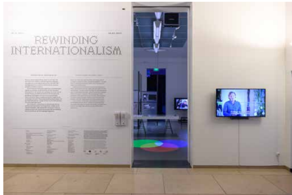
Introductie expositie Rewinding Internationalism