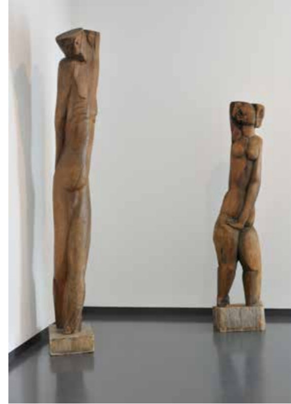
Ossip Zadkine Saint Sébastien , 1929 en Demeter , 1918 Collectie Van Abbemuseum

Zo bouwde Gerrit van Bakel machines die ogenschijnlijk niet bewegen, maar als men daarvoor de tijd neemt, kan men minieme bewegingen opmerken. De natuur is volgens Gerrit van Bakel onderhevig aan het 'Bewegingsprincipe'. Door de afwisseling van dag en nacht ontstaan minieme veranderingen in het materiaal