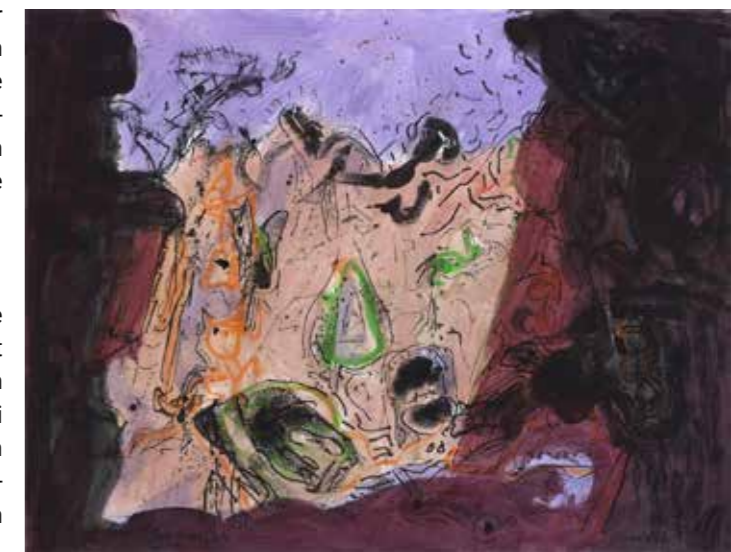
Ad Snijders Niemand's Land, 1992 Collectie Van Abbemuseum