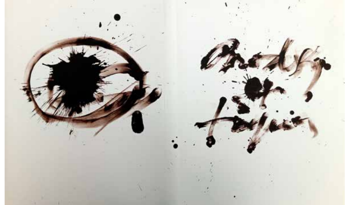
Brodsky en Tàpies Bladen uit Römische Elegien (1993) Collectie Van Abbemuseum

Wat was in je werk je grootste uitdaging?