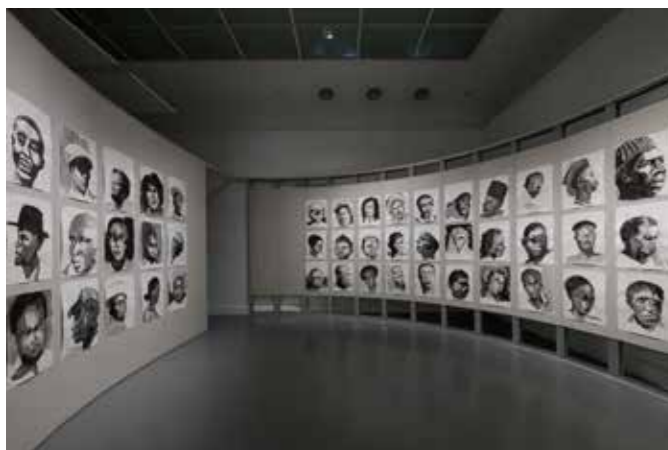
Olu Oguibe Many Thousands Gone (2000)

Naast deze zaal toont Olu Oguibe in Many Thousands Gone (2000) 84 geschilderde portretten van niet geïdentificeerde slachtoffers van de Aids-pandemie. Het zijn deze portretten die, waarschijnlijk onbedoeld, de reeks portretten van Marlene Dumas in de collectie van het museum een dubbele lading geven.