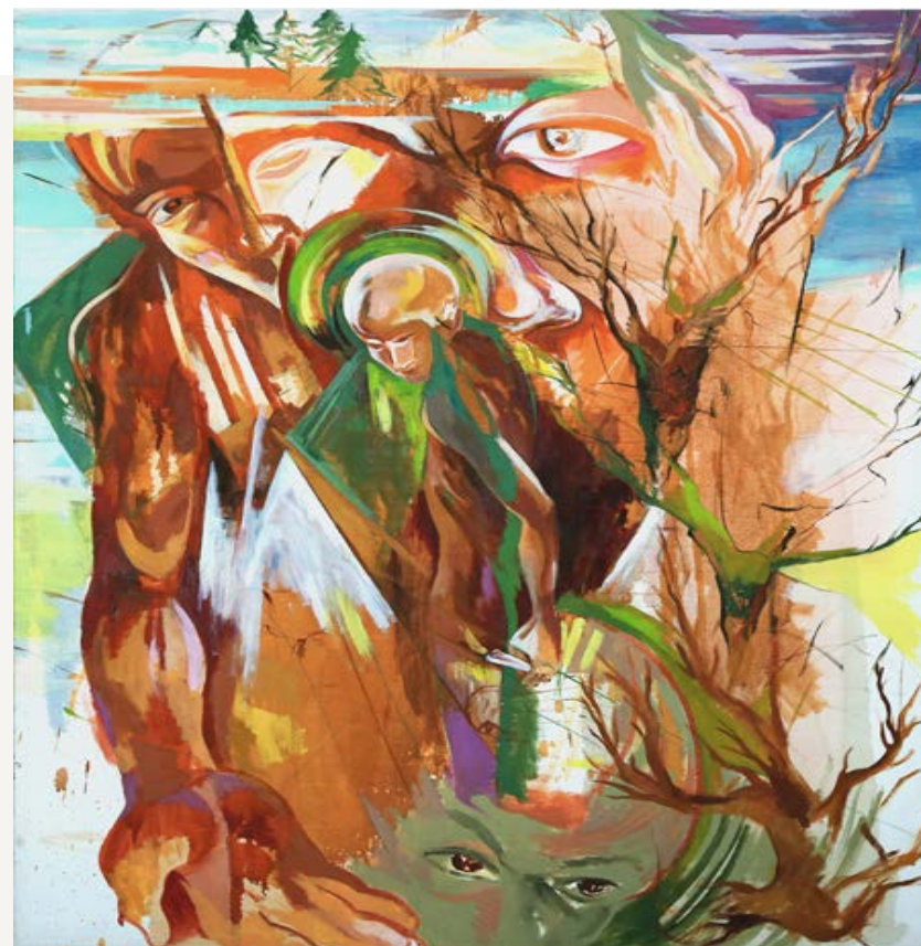
Semsar Siahaan, Untitled , 1999

- Semsar Siahaan, 'Seniku, Seni Pembebasan [Mijn Kunst, Kunst van de Bevrijding]', 1988