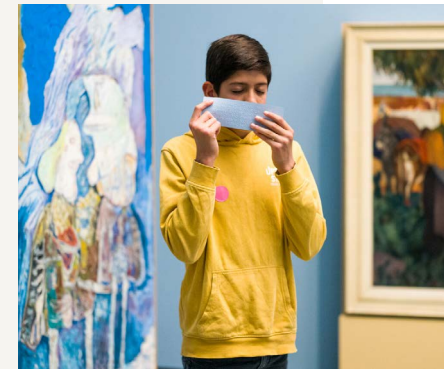
Multizintuiglijk bemiddeling (voelreplica / geurlandschap) in Dwarsverbanden in de collectie van het Van Abbemuseum, 2021-2026