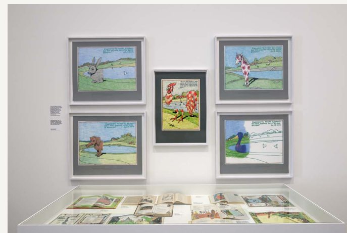
Dwarsverbinding #4: Kabakov Kabinet, 2023