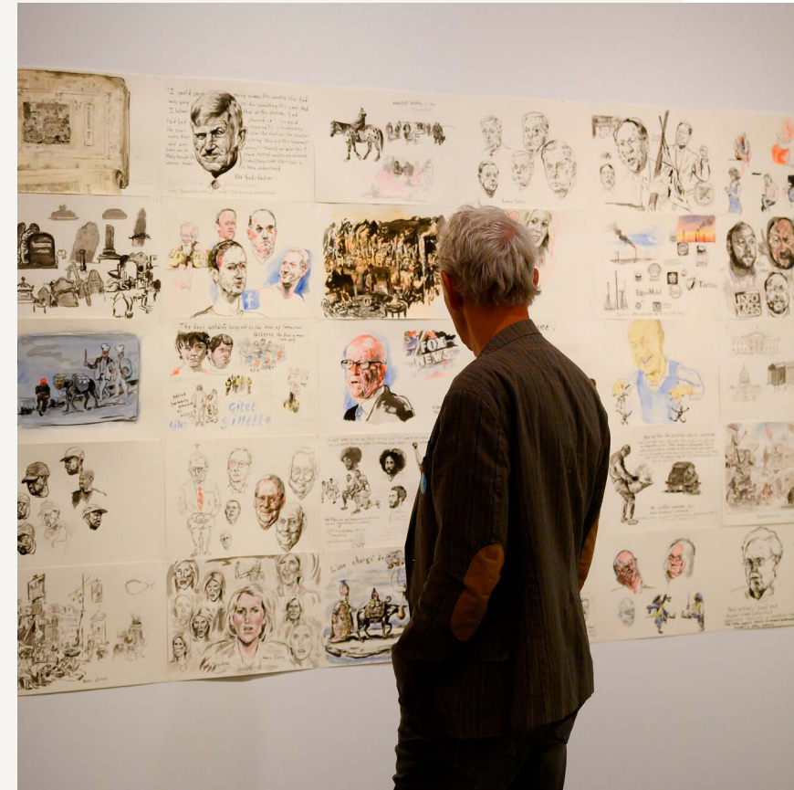
Stijn Peeters, (studies voor) Our Times, Moralized , 2019, in de tentoonstelling Ooggetuigen van Strijd

Daarnaast doen we onderzoek naar onze eigen positie en geschiedenis in relatie tot de sigarenindustrie waarmee het startkapitaal voor het museum is vergaard. In maart 2024 zal over dit onderwerp een presentatie worden gerealiseerd als onderdeel van de collectiepresentatie Dwarsverbanden .