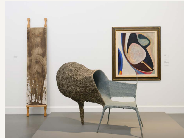
Entree tentoonstelling Museum of Arte Útil, 2012-2013