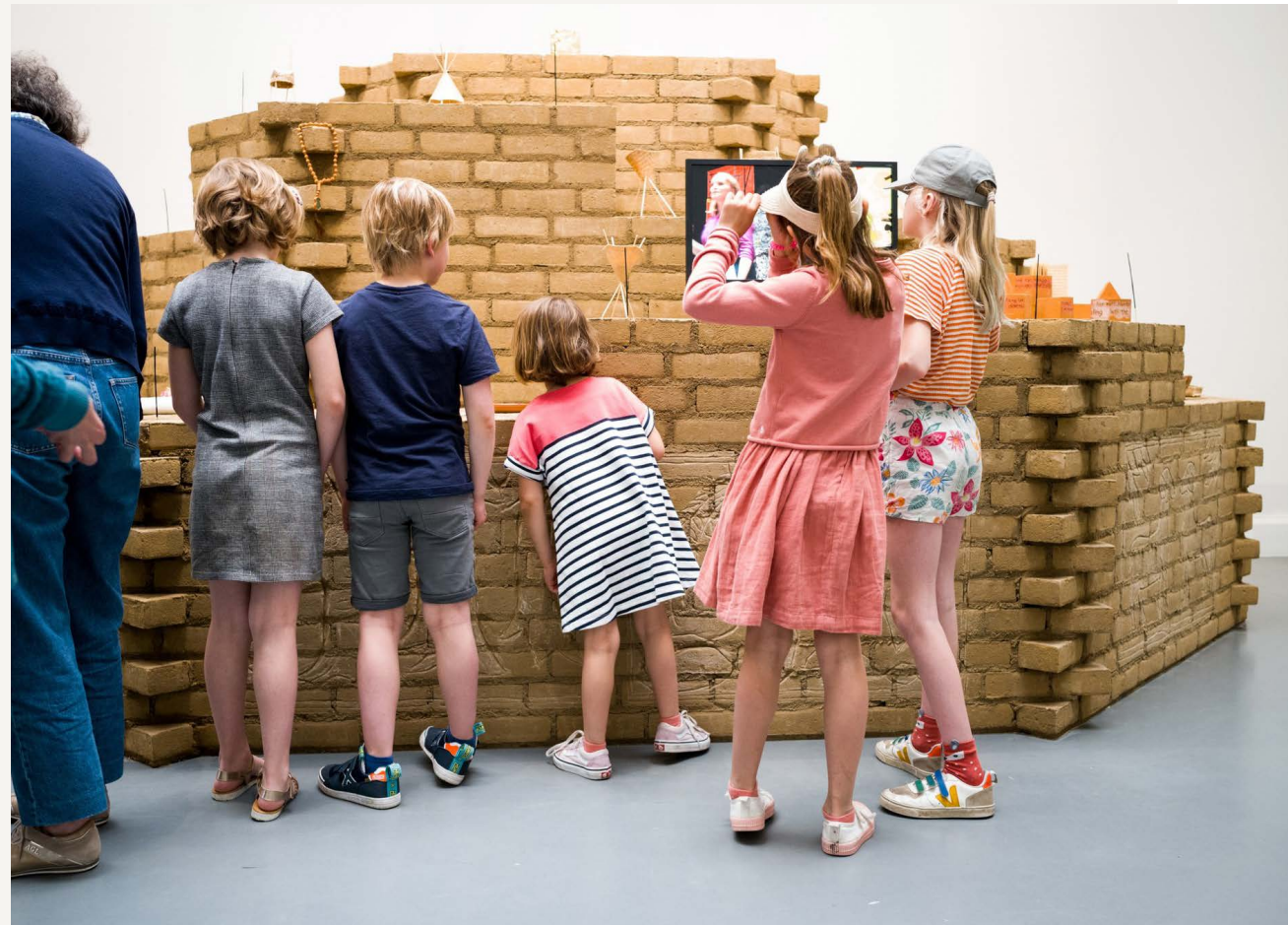
Jatiwangi art Factory (JaF), New Rural Agenda Temple , 2023, foto links Peter Cox / foto boven Joep Jacobs