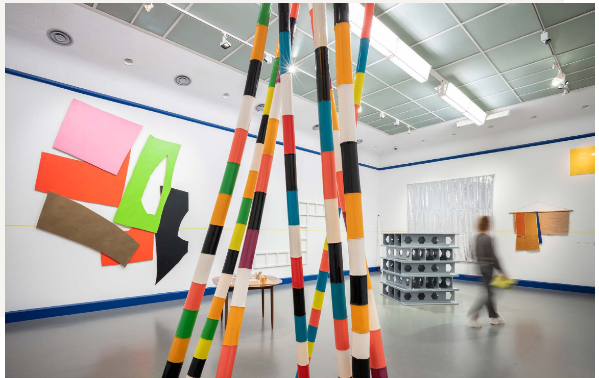
A Lasting Truth is Change , 2022, foto Joep Jacobs

of we tot een nieuwe depot-faciliteit kunnen komen en of dit kansen biedt voor nieuwe samenwerking op onderzoeken en educatiegebied. We willen dit nieuwe depot bewust benaderen vanuit ons demoderne perspectief en nadenken hoe het kan inspelen op een andere vorm van collectieontwikkeling. Dit kan betekenen streven naar een collectie die groeit en krimpt in min of meer gelijke mate.