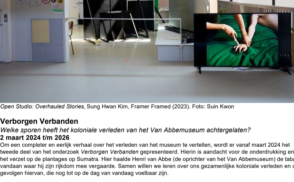
Open Studio: Overhauled Stories, Sung Hwan Kim, Framer Framed (2023).

2 december 2023 t/m 26 mei 2024 Sung Hwan Kim staat bekend om het samenbrengen van veel verschillende kunstvormen: video, muziek, licht en tekenen in droomachtige omgevingen. Vaak zijn deze ruimtes ook het decor voor performances. Deze tentoonstelling daagt je uit om je over te geven aan de buitengewone verbeelding van de kunstenaar. En vooral om mee te gaan met je gevoelens en emoties. De tentoonstelling gaat over migratie en grenzen, terugkerende thema's in Kim's praktijk. Thema's waar de Nederlandse bevolking zich toe kan wenden gezien haar eigen lange migratiegeschiedenis en de huidige discussies in Europa. Kim's poëtische taal biedt ons een noodzakelijk moment van reflectie.