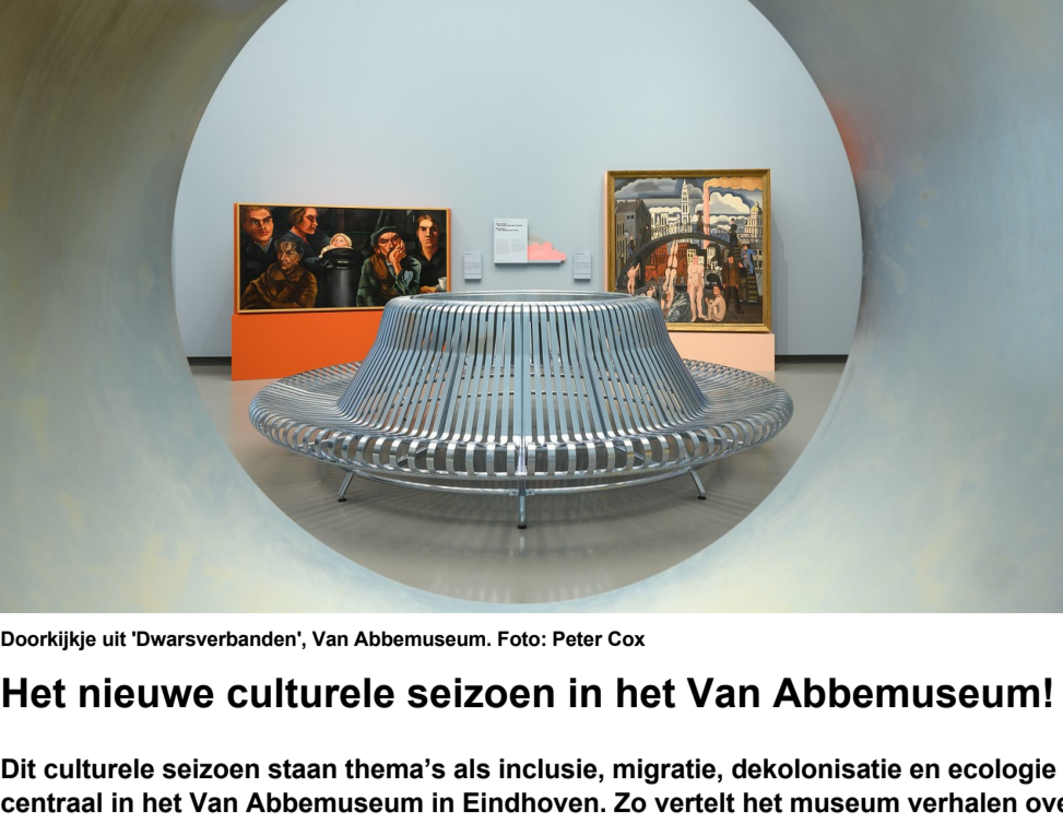
Doorkijkje uit 'Dwarsverbanden', Van Abbemuseum.