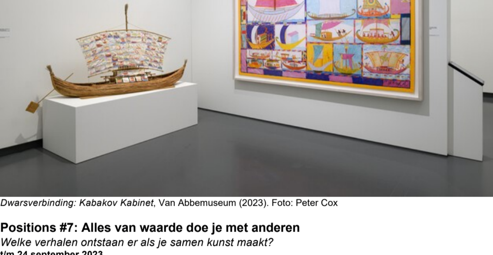
Dwarsverbinding: Kabakov Kabinet, Van Abbemuseum (2023).

Uniek inkijkje in het oeuvre van kunstenaarskoppel Ilya en Emilia Kabakov t/m 24 maart 2024 In 2021 kocht het Van Abbemuseum maar liefst 86 grafische werken van kunstenaarskoppel Ilya en Emilia Kabakov aan. De expositie Dwarsverbinding: Kabakov Kabinet toont een deel van de aankoop, met nooit eerder getoonde werken en al eerder verworven werken van de Kabakovs uit de museumcollectie: van sculpturen tot kinderboekprenten en metersgrote schilderijen. Van 1969 tot nu. Kabakov Kabinet is een van de laatste tentoonstellingen waar Ilya Kabakov aan werkte vlak voor zijn dood in mei 2023.