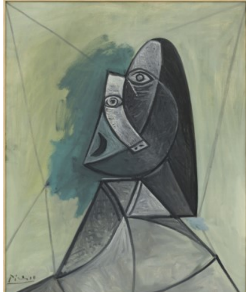
Buste de femme (1943), Pablo Picasso.