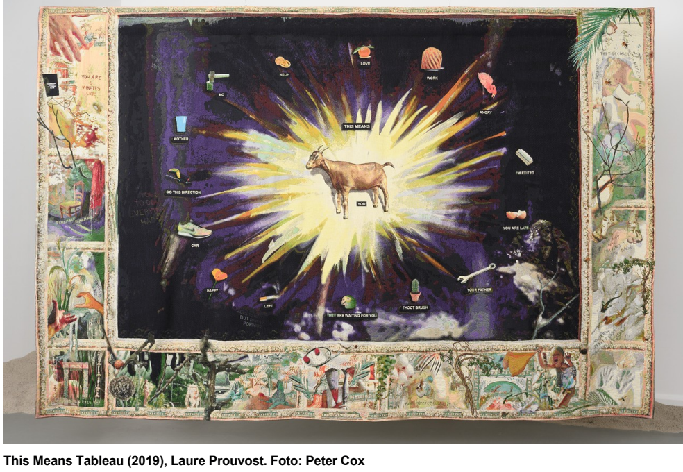
This Means Tableau (2019), Laure Prouvost. Foto: Peter Cox