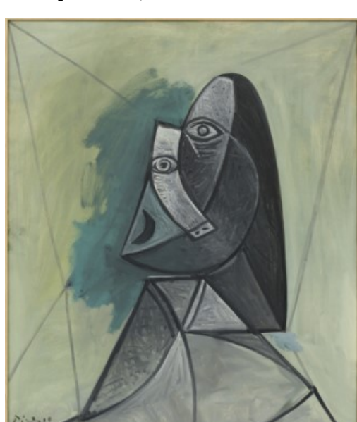
Buste de femme (1943), Pablo Picasso.

In Delinking and Relinking Reshuffled , the works are presented according to their material sensitivity to climate. The first room shows artworks that are most sensitive to climate fluctuations. These include El Lissitzky's drawings from the Proun series, photography by Rineke Dijkstra and the textile piece This Means Tableau by Laure Prouvost. In the second room, artworks of average fragility are exhibited. Think of the well-known Monochrome Blue, sans titre (IKB 63) by Yves Klein, Stanley Brown's metal measuring instruments and Otobong Nkanga's Scaffolding Series . Surprisingly, oil paintings, including famous works such as Pablo Picasso's Buste de femme , Charley Toorop's Volkslogement and Iris Kensmil's Angela Davis #2 , are less sensitive to climate fluctuations.