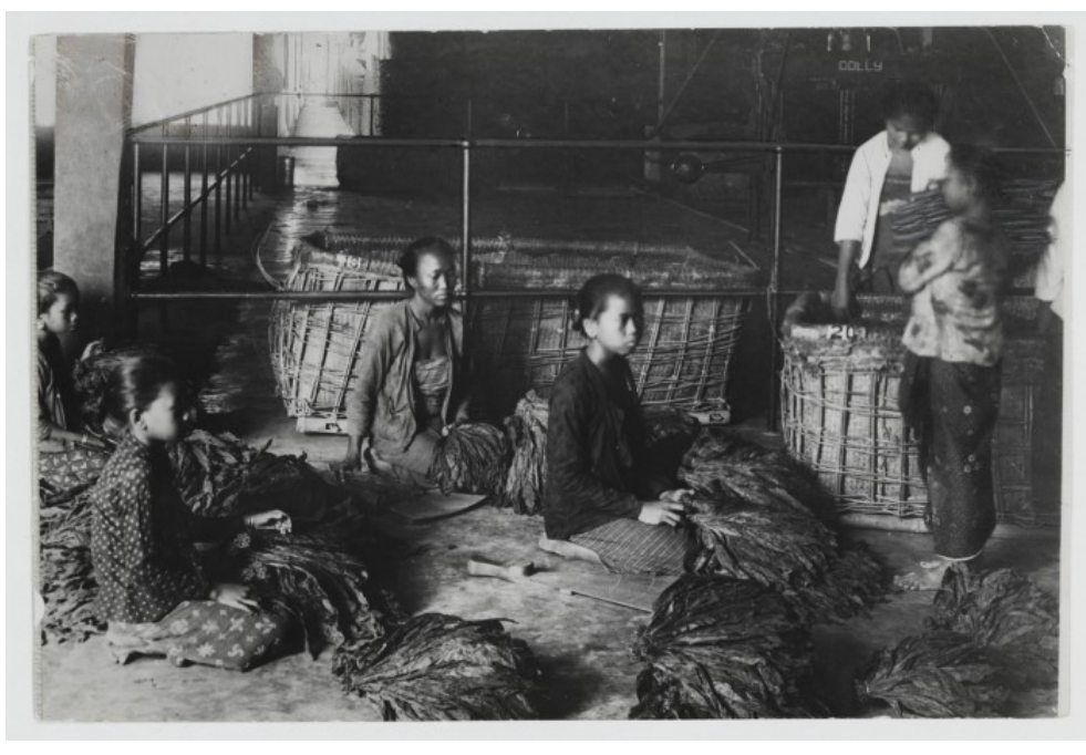
Vrouwen sorteren tabaksbladeren op lengte in een loods op onderneming Tegal-sirondo (ook wel Tegal-gondo) bij Oengaran ten zuiden van Semarang c. 1910 Universitaire Bibliotheek Le. Fotograaf onbekend.