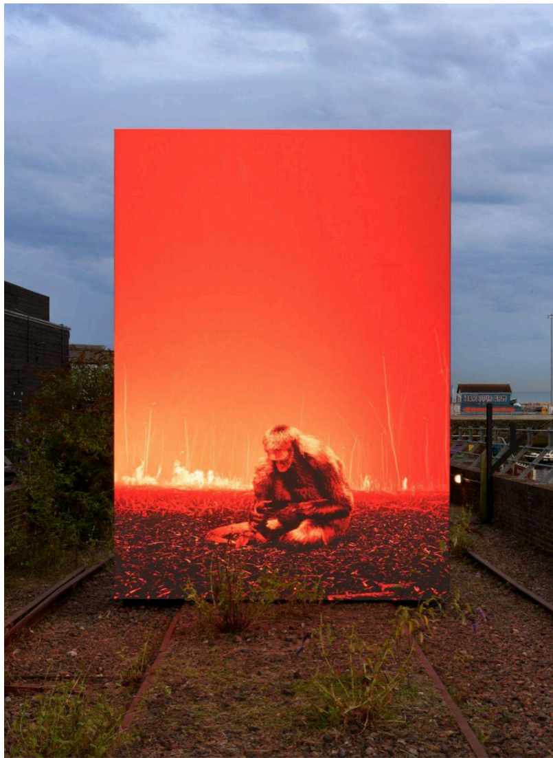
john gerrard, Ghost Feed , 2025, game engine based computer simulation. Installation view, Folkestone Triennial.